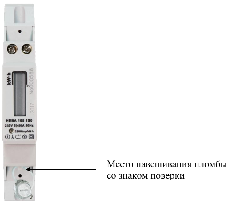
Рисунок 6 - Внешний вид модификации НЕВА 105 с местом опломбирования и местом нанесения знака поверки