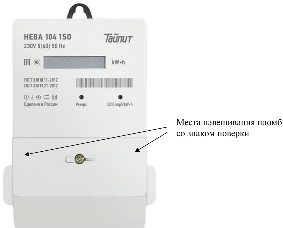
Рисунок 5 - Внешний вид модификации НЕВА 104 с местом опломбирования и местом нанесения знака поверки