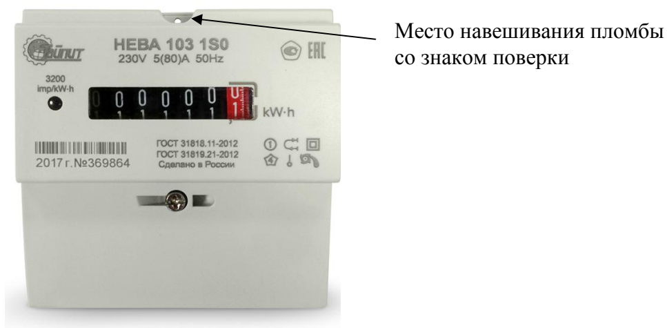
Рисунок 3 - Внешний вид модификации НЕВА 103 с местом опломбирования и местом нанесения знака поверки