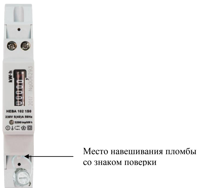
Рисунок 2 - Внешний вид модификации НЕВА 102 с местом опломбирования и местом нанесения знака поверки